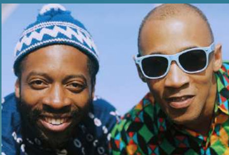
DjeuhDjoah & Lieutenant Nicholson Tropical Funk