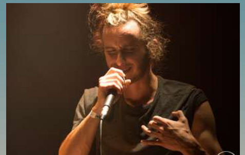
Matéo Langlois Chanson

Cliquez sur les images pour plus d'infos sur les artistes.