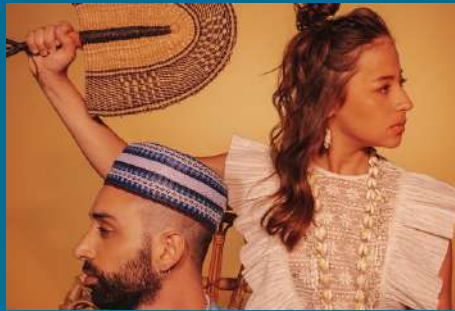
Andriamad Tropical électro