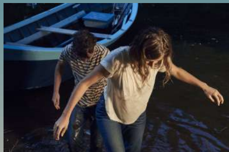
Huit Nuits Chanson