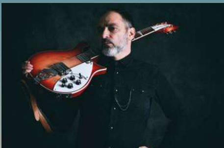
Dimoné Chanson rock